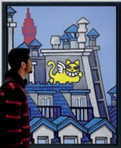
"M.Chat volants sur les toits", 2024 M.CHAT