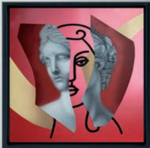
"Finesse", 2025 César Mall