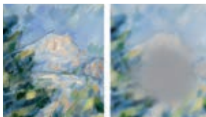
Tableau vu avec un DMLA