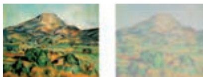
Tableau vu avec une cataracte